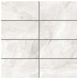
Fumée | Smoke