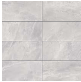
Gris pâle | Light Grey