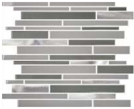
Super blanc | Super White