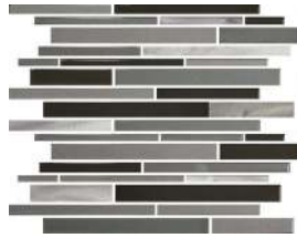
Charbon | Charcoal

Le format illustré ci-dessus est 12" x 12". Certaines faces ne sont pas illustrées. / The format shown above is 12" x 12". Not all the faces are shown.