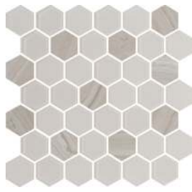
Crème | Cream