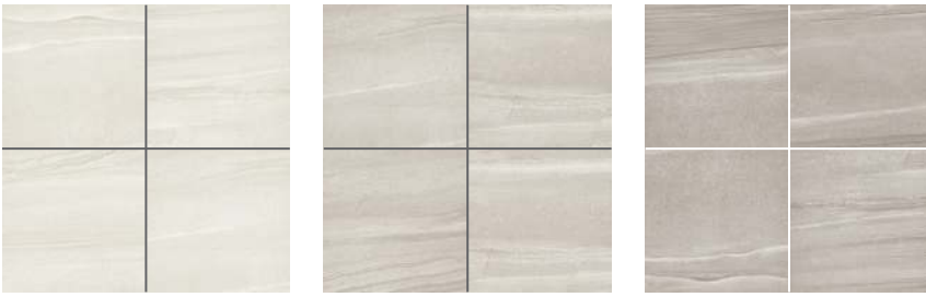
Blanc | White