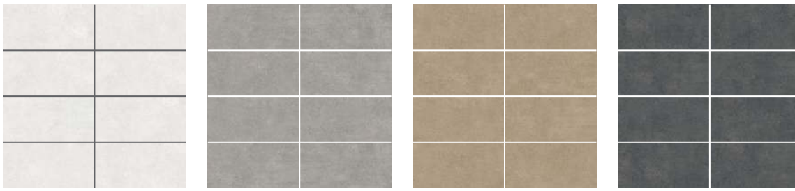
Blanc | White